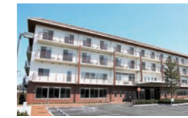
S 海老名ケアサポートセンター (医療・介護・住宅複合施設)

病床数 352床 職員数 482人 診療科目 内科(総合診療科)、消化器内科、糖尿病内科、循環器内科、神経内科、漢方内科、小児科、外科、整形外科、リハビリテーション科、脳神経外科、形成外科、皮膚科、泌尿器科、眼科、耳鼻咽喉科、麻酔科、放射線科 センター 人工関節・リウマチセンター(リウマチ科)