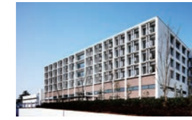
J 座間総合病院 (急性期・回復期・慢性期)

診療科目 内科、糖尿病センター 外来、消化器内科、血液内科、神経内科、呼吸器内科、小児科、外科、整形外科、形成外科、泌尿器科、眼科、耳鼻咽喉科、放射線科、皮膚科、リウマチ膠原病内科、在宅診療科