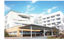
J 海老名総合病院 (高度急性期・急性期)

病床数 469床 (他に集中治療室10床、無菌治療室9床) 職員数 1,124人 診療科目 総合診療科、血液内科、呼吸器内科、腎臓内科、小児科、外科、整形外科、形成外科、泌尿器科、脳神経外科、眼科、呼吸器外科、放射線科、IVR科、麻酔科、病理診断科、リハビリテーション科、歯科・歯科口腔外科 センター 心臓血管センター(循環器内科・心臓血管外科)、内視鏡センター(消化器内科)、マタニティセンター(産科・婦人科)、糖尿病センター、救命救急センター(救急科)