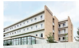
J 東埼玉総合病院 (急性期)

病床数 173床 職員数 455人 診療科目 内科、呼吸器内科、循環器内科、消化器内科、糖尿病・代謝・内分泌内科、神経内科、外科、消化器外科、乳腺・内分泌外科、血管外科、整形外科、脳神経外科、形成外科、皮膚科、リウマチ科、泌尿器科、眼科、耳鼻咽喉科、リハビリテーション科、放射線科、麻酔科、在宅診療科 センター 埼玉脊髄病センター、地域糖尿病センター