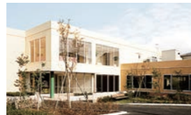
J 東埼玉総合病院附属 清地クリニック (外来)

病床数 173床 職員数 455人 診療科目 内科、呼吸器内科、循環器内科、消化器内科、糖尿病・代謝・内分泌内科、神経内科、外科、消化器外科、乳腺・内分泌外科、血管外科、整形外科、脳神経外科、形成外科、皮膚科、リウマチ科、泌尿器科、眼科、耳鼻咽喉科、リハビリテーション科、放射線科、麻酔科、在宅診療科 センター 埼玉脊髄病センター、地域糖尿病センター