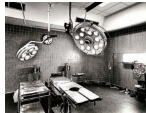
開院当時の手術室