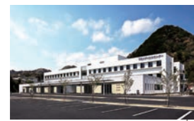
S 下田メディカルセンター (急性期・回復期)

病床数 150床 職員数 180人 診療科目 内科、消化器内科、循環器内科、神経内科、外科、整形外科、小児科、眼科、耳鼻咽喉科、婦人科、脳神経外科、皮膚科、形成外科、泌尿器科、リハビリテーション科、麻酔科