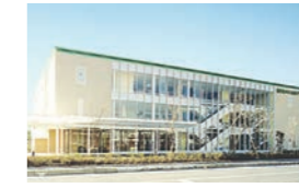
J 海老名メディカルプラザ (外来)

診療科目 内科、糖尿病センター 外来、消化器内科、血液内科、神経内科、呼吸器内科、小児科、外科、整形外科、形成外科、泌尿器科、眼科、耳鼻咽喉科、放射線科、皮膚科、リウマチ膠原病内科、在宅診療科