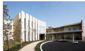
C 特別養護老人ホーム はなみずき